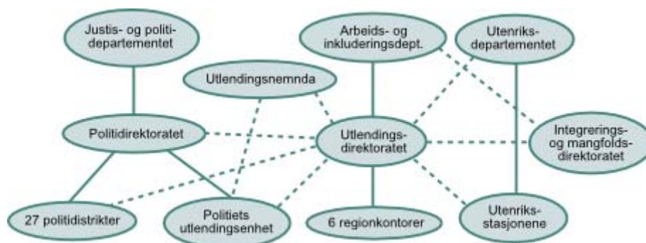
Figur 1: Oversikt over utlendingsforvaltningen 2

Utlendingsfeltet er et komplekst og dels ustabilt politikkområde preget av spenning mellom politisk styring og faglig autonomi. Ansvar for utlendingsforvaltningen er delt mellom tre departementer, Arbeids- og inkluderingsdepartementet (AID), Justis- og politidepartementet (JD) og Utenriksdepartementet (UD).