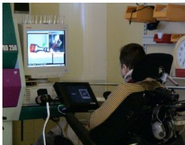
Foto fra produksjonen av sjakkbrikker, kjøkkenknotter, etc.