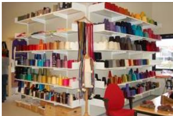
Foto fra strikkevirksomheten