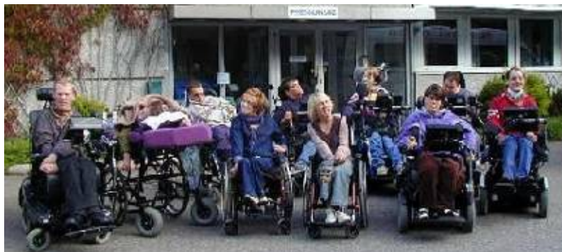
Foto av arbeidstakere fra den opprinnelige målgruppen.

joystick eller tilpassede brytere. Bortsett fra de to arbeidstakerne som har talespråk, kommuniserer alle ved hjelp av tegn, kroppsspråk, lyder og med IT-basert kommunikasjons hjelpemiddel. Rolltalk er valgt som kommunikasjons hjelpemiddel og det benyttes også til omgivelseskontroll, for justering av sittestilling, styring av rullestol og styring av industrimaskiner. Enkelte arbeidstakere benytter bliss-symboler, noen bruker pictogram og noen bruker helt eller delvis ordinære skrive- og leseopplegg.