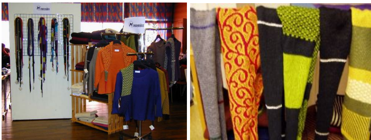
Foto av produkter fra strikkevirksomheten

Strikkevirksomheten ønsker å utvikle produksjonen til å omfatte plagg som krever montering og manuelt arbeid. De opprinnelige arbeidstakerne er ikke i stand til å utføre manuelt arbeid på grunn av de fysiske funksjonsnedsettelsene. Dette er en av grunnene til at prosjektet har ønsket å rekruttere arbeidstakere uten fysiske funksjonsnedsettelse gjennom VTA. I perioder har umonterte strikkeprodukter blitt liggende, fordi det har vært for liten kapasitet til å ta de manuelle oppgavene, som montering og søm. Det har vært en utfordring å rekruttere arbeidstakere som ønsker å arbeide med montering og søm av strikkeplagg. Gjennom Grep er det initiert et samarbeid med sømavdelingen ved en av arbeidsmarkedsbedriftene for å øke kapasiteten.