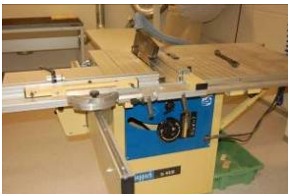
Foto over fra industrivirksomheten som viser deler av maskinparken