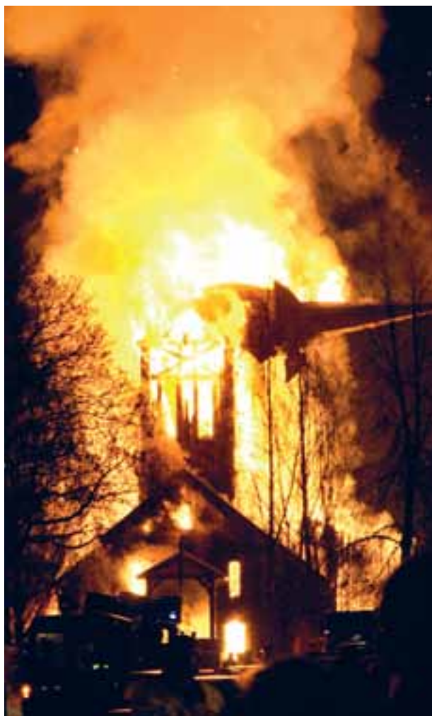
Hønefoss kyrkje brann ned til grunnen i januar 2010.

Dei freda kyrkjene har hatt størst endring i tilstand på yttervegger. Tal frå tilstandsvurderingane viser at delen med utilfredsstillande tilstand er redusert frå 44 til 25 prosent. For yttertak og tårn er det kyrkjene som er bygde i perioden 1650–1850 som har hatt størst reduksjon i delen utilfredsstillande tilstand, frå 32 til 21 prosent. Tilstandsvurderingane av grunn og fundament viser at det for dei freda kyrkjene har vore ein svak auke i delen med utilfredsstillande tilstand. Frå 2005/06 til 2009/10 har delen auka frå 15,1 til 15,5 prosent.