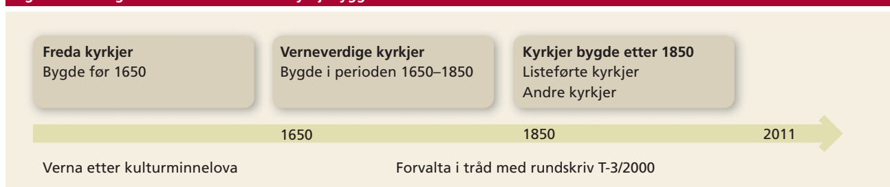
Figur 1 Alder og vernestatus for norske kyrkjebygg

Tilstandsvurderinga viser at tilstanden til 586 kyrkjer, altså 37 prosent, er vurdert som utilfredsstillande. Tilstanden til 993 kyrkjer, altså 63 prosent, er vurdert som tilfredsstillande. Utilfredsstillande tilstand tyder tilstandsgrad 2 eller 3. Tilfredsstillande tilstand tyder tilstandsgrad 0 eller 1.