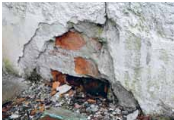
Trøgstad kyrkje (2011). I tilstandsvurderinga frå 2009/10 er det oppgitt at ytterveggene på kyrkja har tilstandsgrad 2, tak og tårn tilstandsgrad 3 og grunnmur og fundament tilstandsgrad 1. Kyrkja er freda.